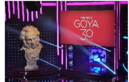
GALA DE LOS PREMIOS GOYA 2016 GALA DE LOS PREMIOS GOYA 2016

ALFALITE | P.I. INDUSTRIAL DOÑA PACA, C/ ZALEMA, 2. C.P. 21720 ROCIANA DEL CONDADO. HUELVA, ESPAÑA