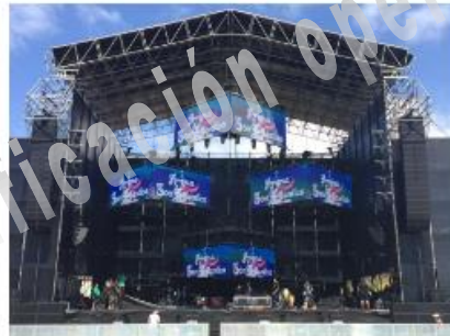
RICKY MARTIN EN CONCIERTO CON SU GIRA ONE WORLD TOUR RICKY MARTIN 2016