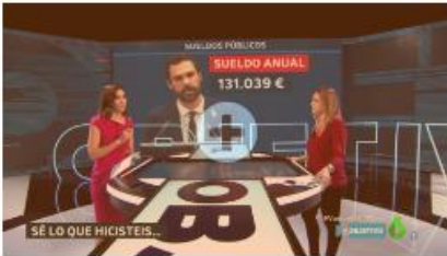
"EL OBJETIVO", LA SEXTA PANTALLA LED DE ALTO REFRESCO Y CONTRASTE