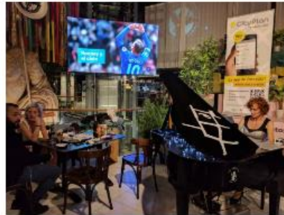
PANTALLA LED GIGANTE EN PUERTA CINEGIA EN ZARAGOZA PANTALLA LED GIGANTE PUERTA CINEGIA (ZARAGOZA)