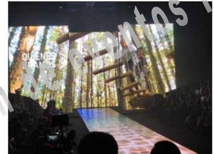
IX CERTAMEN JÓVENES DISEÑADORES 2017 IX CERTAMEN JÓVENES DISEÑADORES