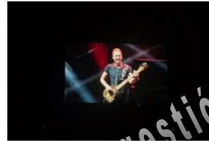
STING 2017 CONCIERTO DE STING EN FUENGIROLA