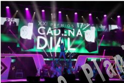
PREMIOS CADENA DIAL 2017 PREMIOS CADENA DIAL 2017