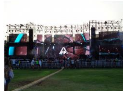
ARONA SUMMER FESTIVAL 2016 ARONA SUMMER FESTIVAL 2016